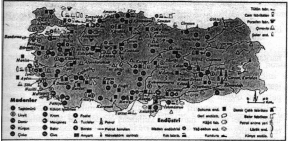
Harita: 4 - Türkiye Maden ve Endüstri Haritası

Ekonomik haritalarda temelde beşeri haritalar gibi hazırlanırken fiziki haritalardan faydalanılır. Ancak unsurları ifade eden semboller ekonomik coğrafyaya ait verileri temsil eder.