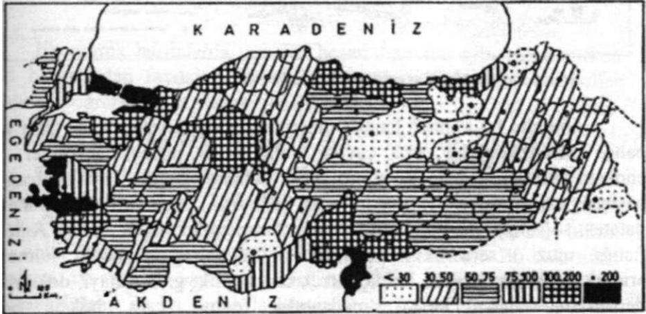
Hanlar t iline 901» Türkiye» rrtmatik mihı» yoğunluğu haması 11990ı

Beşeri coğrafya konularında hazırlanmış nüfus haritaları (Harita:2), yerleşme haritaları, idari bölünüş haritaları, siyasi haritalar, keşif haritaları... gibi haritaları saymak mümkündür. Beşeri haritalar hazırlanırken Fiziki haritalardan yararlanır. Ancak hazırlanan haritalarda beşeri unsurlar tarama, renklendirme ve semboller ifade edilir. Beşeri haritaların sembollerle ifade edilmesine bağlı olarak daha fazla bir