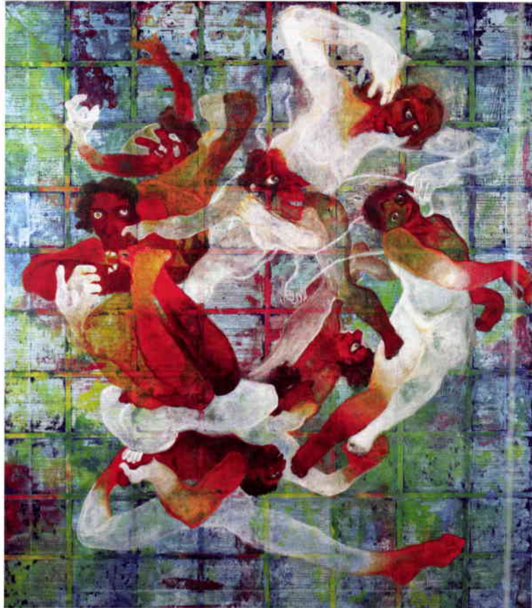
Çark-ı Felek, 120 x 140 cm, Tual Üzerine Karışık Teknik

2002 Afyon Kocatepe Üniversitesi Güzel Sanatlar Fakültesi'nde göreve atandı, halen aynı kurumunda öğretim görevlisidir.